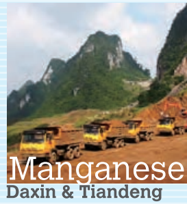
Manganese Daxin & Tiandeng